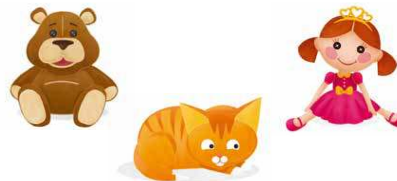
FIGUR 54: EN SKA BORT: NALLEBJÖRNEN, KATTUNGEN ELLER DOCKAN

För att förenkla uppgiften kan du minska antalet kort eller föremål som barnen ska fundera över. Du kan också använda strategin "En ska bort" och bara låta dem jämföra tre olika föremål i stället för hela samlingen. Till exempel: