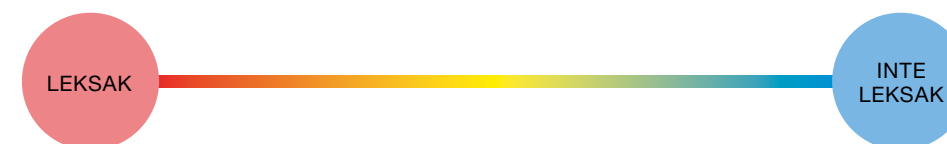
FIGUR 53: BEGREPPSLINJE ÖVER LEKSAKER

Som ett alternativ kan barnen lägga korten i en rad eller utmed en begreppslinje (ett långt snöre eller rep) med de tydligaste exemplen på leksaker i ena änden och de som har minst sannolikhet att vara leksaker i den andra. Sedan kan de placera in de övriga korten/föremålen på lämpliga ställen utmed linjen för att visa i vilken grad de är en leksak eller inte.